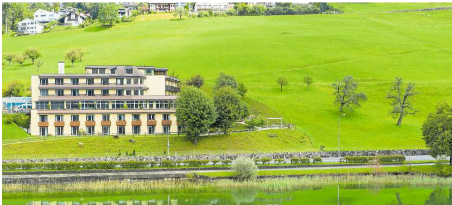
Das Pflege- und Alterszentrums Breiten (unteres Bild) genügt den Anforderungen als Pflegeheim nicht mehr. Die Visualisierung zeigt, wie es künftig aussehen könnte. Visualisierung: PD/Mathis & Meier Architekten AG, Bild: Jan Pegoraro (Oberägeri, 5. August 2021)

von der Grösse her dem heutigen Standard entsprechend gestaltet werden. Die Studie sieht deshalb eine Entfernung der alten Balkone und eine Korrektur der Fensterfronten zu Gunsten der Zimmer vor. Unabhängig von der Fensterfrontkorrektur sind neue Balkone geplant, welche in einem einheitlichen Raster an der Südfassade des Zentrums gebaut werden sollen.