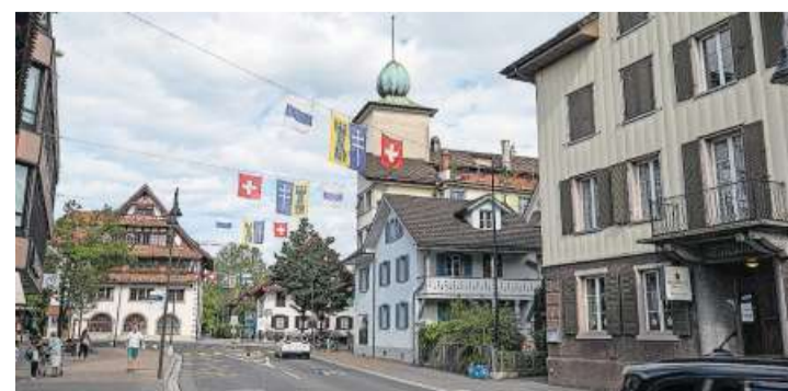
Der Turm des Grosshauses in Baar.